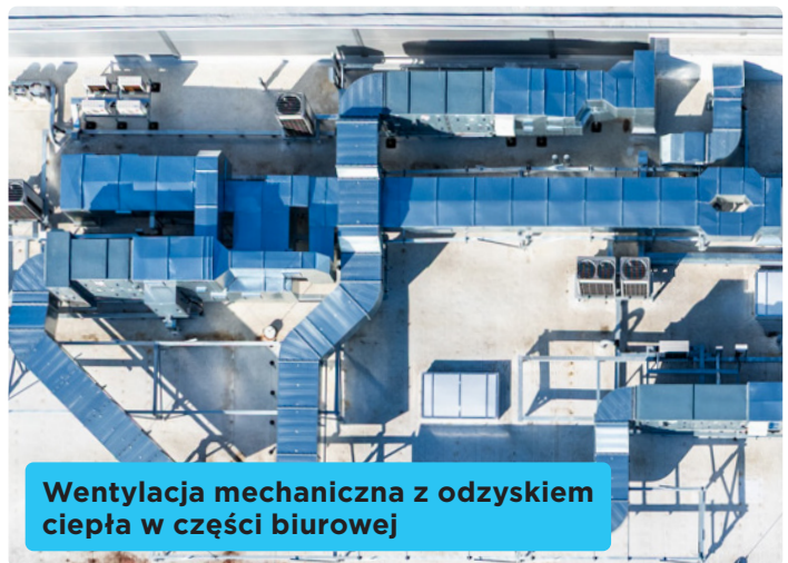
Wentylacja mechaniczna z odzyskiem ciepła w części biurowej