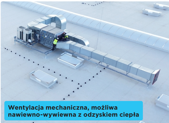
Wentylacja mechaniczna, możliwa nawiewno-wywiewna z odzyskiem ciepła