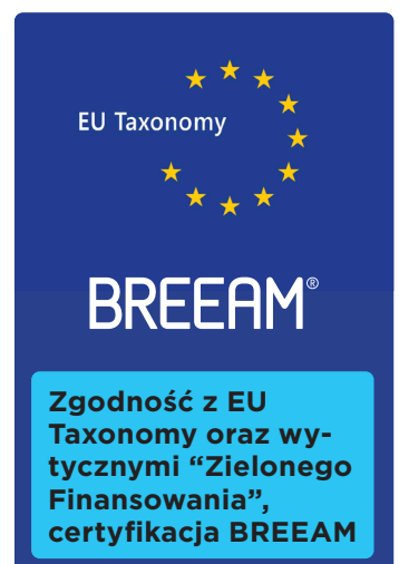
Zgodność z EU Taxonomy oraz wytycznymi "Zielonego Finansowania", certyfikacja BREEAM