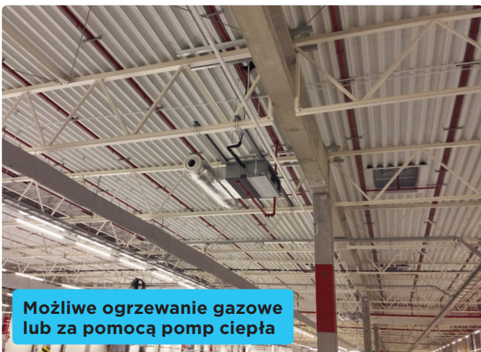
Możliwe ogrzewanie gazowe lub za pomocą pomp ciepła