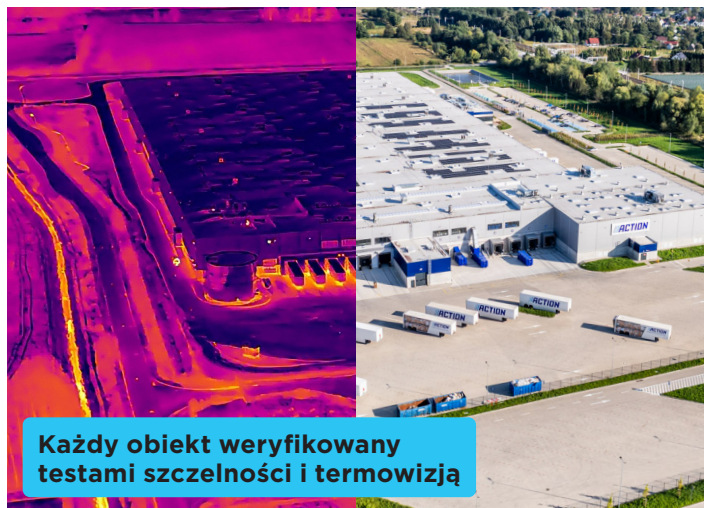
Każdy obiekt weryfikowany testami szczelności i termowizją