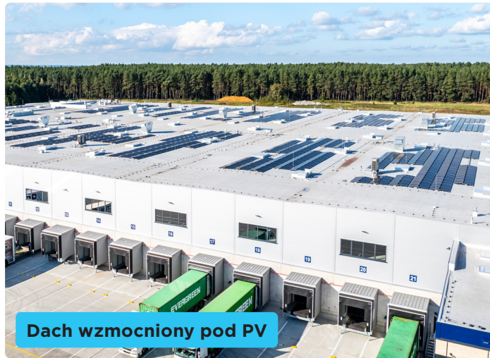
Dach wzmocniony pod PV