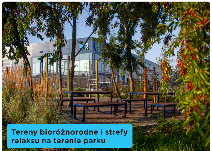
Tereny bioróżnorodne i strefy relaksu na terenie parku