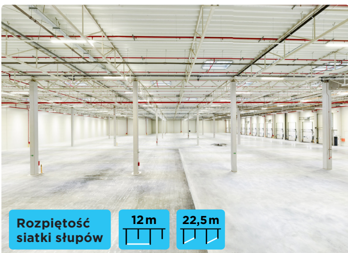
Rozpiętość siatki słupów