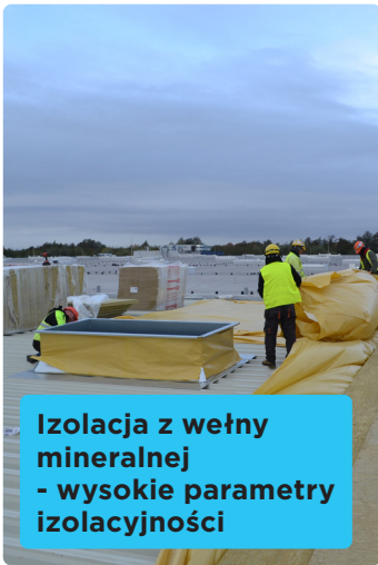
Izolacja z wełny mineralnej - wysokie parametry izolacyjności