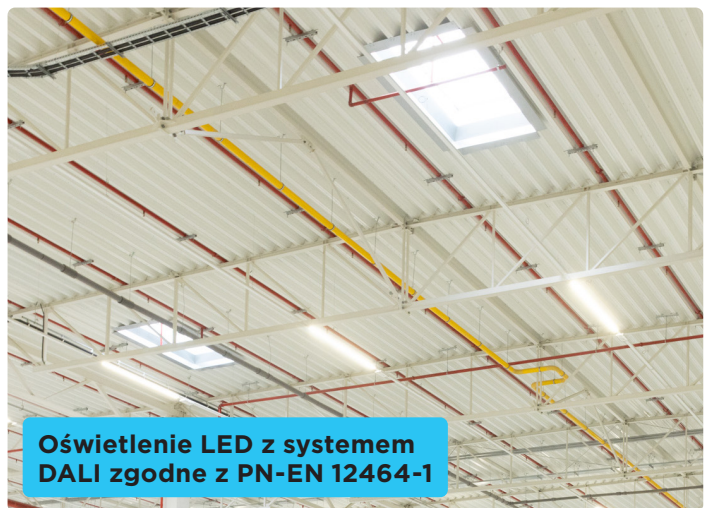
Oświetlenie LED z systemem DALI zgodne z PN-EN 12464-1