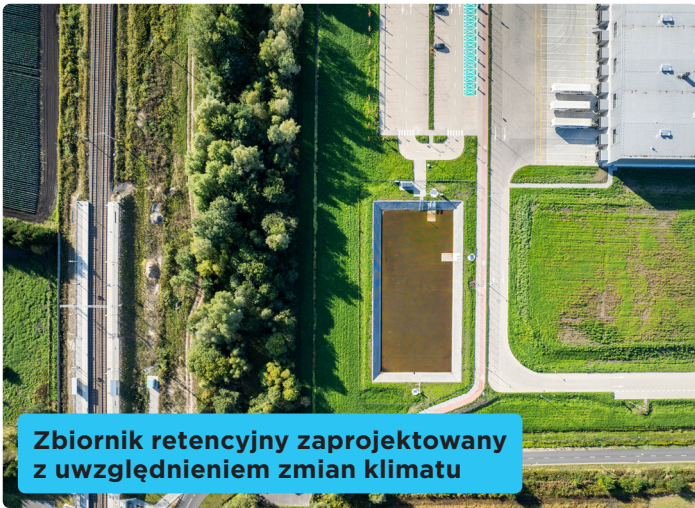
Zbiornik retencyjny zaprojektowany z uwzględnieniem zmian klimatu