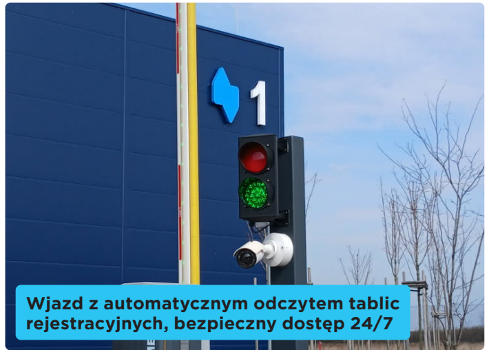
Wjazd z automatycznym odczytem tablic rejestracyjnych, bezpieczny dostęp 24/7