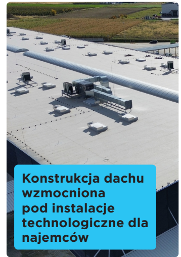
Konstrukcja dachu wzmocniona pod instalacje technologiczne dla najemców