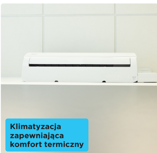
Klimatyzacja zapewniająca komfort termiczny