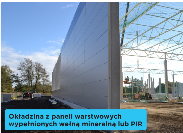
Okładzina z paneli warstwowych wypełnionych wełną mineralną lub PIR